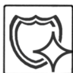
СРЕДСТВО С ЗАЩИТНЫМ ЭФФЕКТОМ