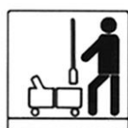
ОЧИСТКА НАПОЛЬНЫХ ПОКРЫТИЙ