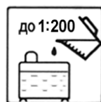
РАЗБАВЛЕНИЕ ВОДОЙ до 1:200